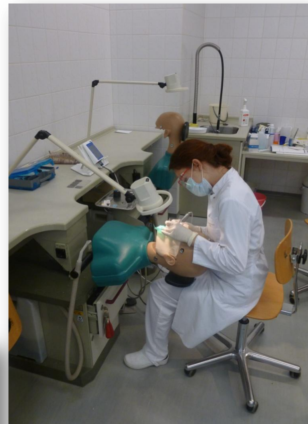
Занятия в фантомном центре