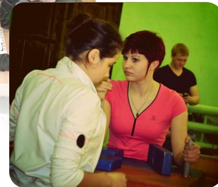
Таблица спартакиады общежитий вузов г. Волгоград -2013