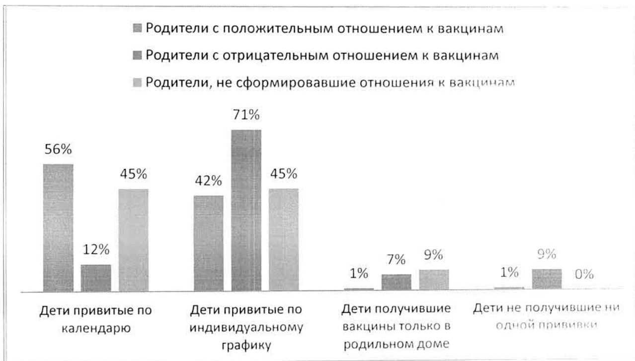
Диаграмма № 1 Охват прививками в группах детей, у родителей которых отношение к необходимости проведения прививок было различным.

Интересным фактом явилось нежелание 2% респондентов первой группы (то есть положительно относящихся к иммунопрофилактике) вакцинировать своих детей, мотивируя отказ наличием у ребенка хронического заболевания.