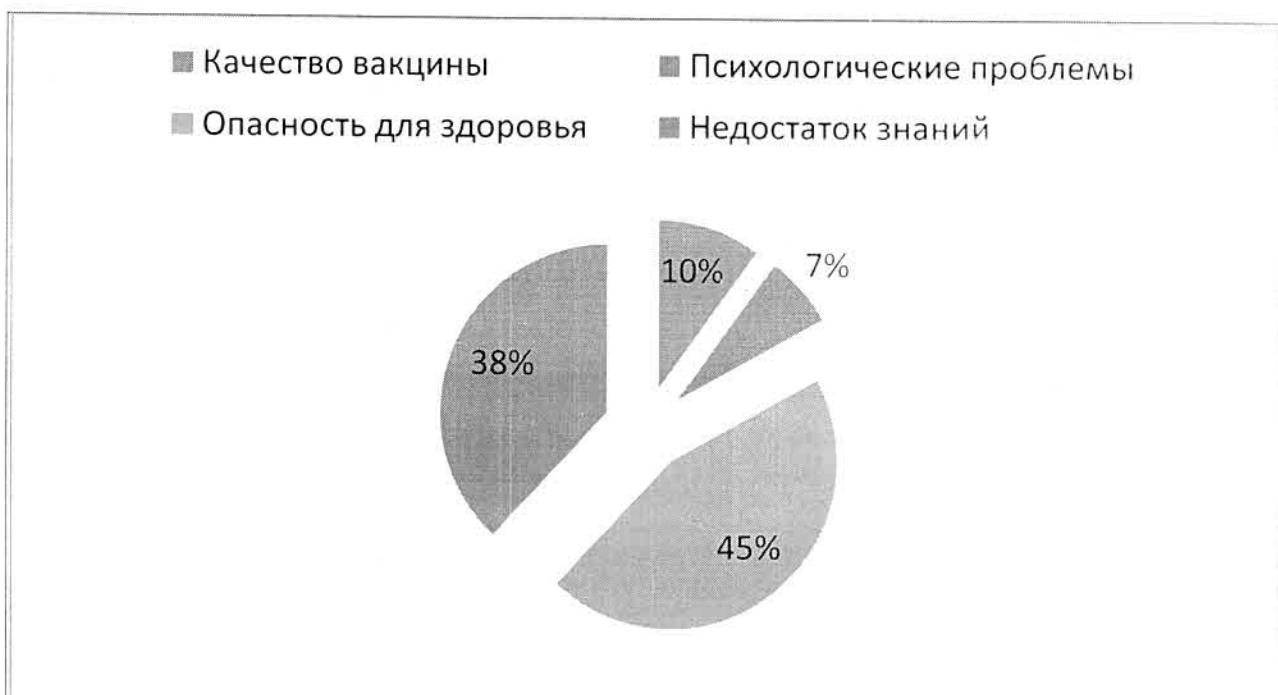
Рис. 1 Частота указания причин отказа от вакцинации

Так же было собрано мнение о том, что: проведение активной иммунизации бесполезно (15%), вакцинация не нужна, так как дифтерия, полиомиелит, коклюш, паротит, столбняк в нашей стране встречаются редко (12%), прививки ослабляют иммунную систему (39%), несколько вакцинальных компонентов в одном шприце – слишком большая нагрузка на иммунитет ребенка (26%), прививки представляют собой угрозу для духовного и психического развития ребенка (8%).