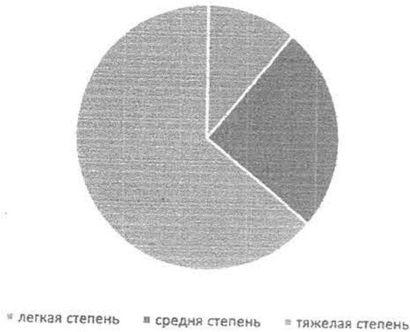
Распределение по степени тяжести бронхиальной астмы

Из объективного обследования было выявлено, что перкуторно – ясный легочный звук и аускультативно – везикулярное дыхание у 26,7%(8), ясный легочный звук и жесткое дыхание у 53,3%(16), коробочный легочный звук, жесткое дыхание, сухие хрипы у 20%(6). Данные спирометрии до назначения базисной терапии выглядели следующим образом: ОФВ1 \geq 80% от должного зарегистрирован у 60%(18) пациентов, ОФВ1 80 – 60% от должного – у 26,7%(8) и менее 60% от должного – у 13,3%(4)