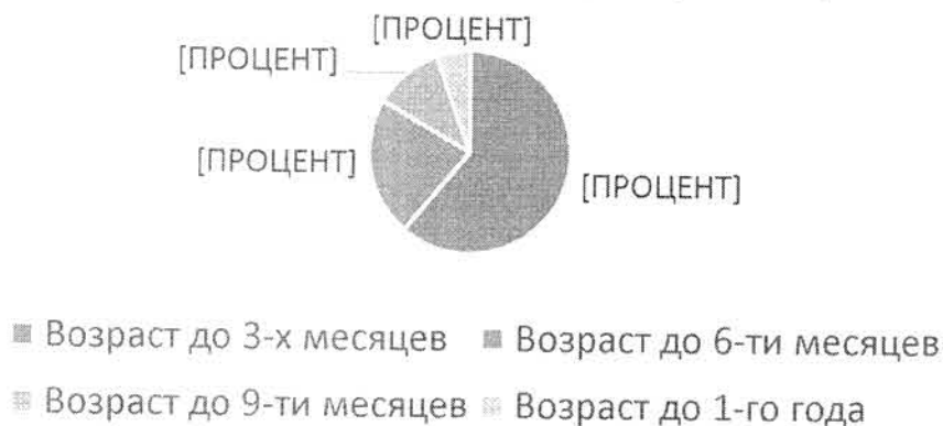
Девочки с диагнозом ЖДА (диаграмма 4)

Выявление анемии до 3-х месяцев позволяет провести коррекцию дефицита железа как можно раньше, что является залогом правильного развития ребенка — железо участвует в построении некоторых структур головного мозга и его дефицит приводит к серьезным нарушениям обучаемости и поведения. Эти нарушения очень стойки, возможно, пожизненны.