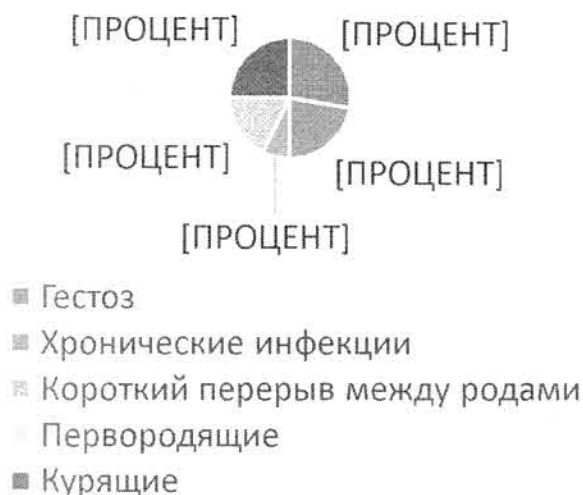
Дородовый патронаж (диаграмма 5)

На грудном вскармливании находились 64 % детей, на искусственном — 36 %. У 75 % детей были выставлены диагнозы неонатальная и конъюгационная желтуха. 29 % детей родились с массой более 3800 г; 14 % имели массу при рождении менее 3000 г.