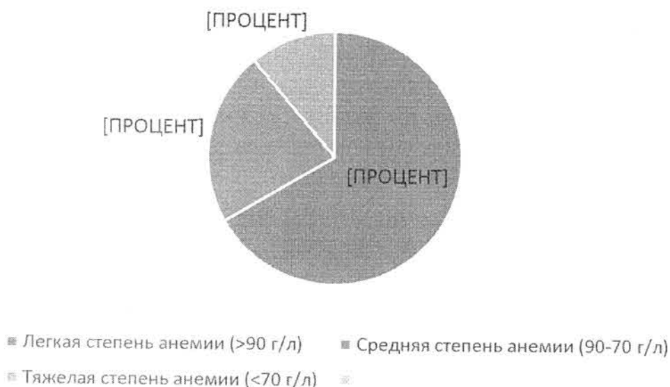
Всего детей с диагнозом ЖДА (диаграмма 1)

Дефицит железа у детей до 1 года жизни, обусловленный различными патологиями и негативными факторами воздействия: