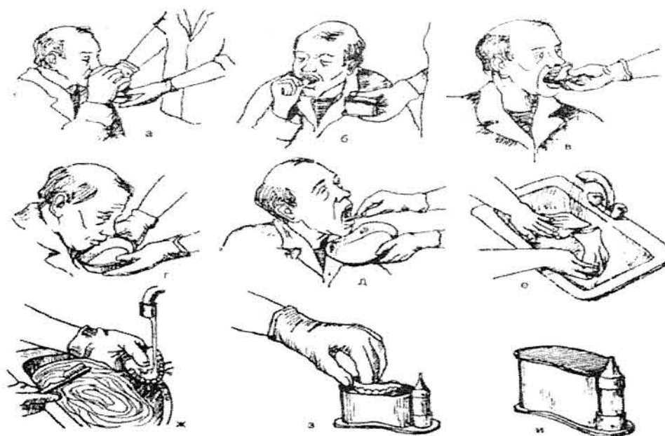
Техника введение лекарства в конъюнктивальный мешок