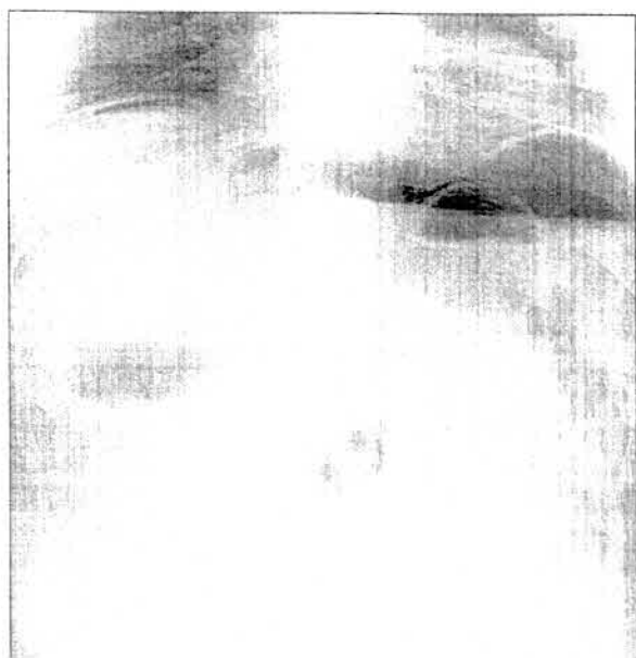
Рис.2. Обзорная рентгенограмма живота. Свободный газ под диафрагмой (перфорация полого органа)

Общие принципы традиционного рентгенологического исследования: