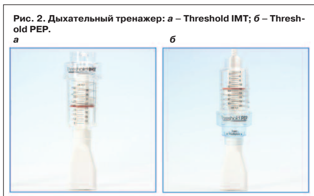
Рис. 2. Дыхательный тренажер: а – Threshold IMT; б – Threshold PEP.