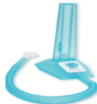
Рис. 1. Побудительный спирометр.

Побудительная спирометрия использует упражнения, задаваемые больному с количественно определяемым результатом [7, 11]. Побуждающие спирометры позволяют пациенту самостоятельно выполнять необходимые упражнения и при этом видеть свои достижения (рис. 1). Возможность самостоятельной регулировки прибора (по программе, заданной врачом) с дозированным наращиванием нагрузки и наглядным улучшением результатов побуждает пациента к столь необходимому после операции глубокому дыханию.