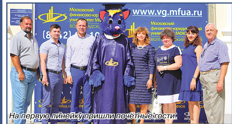
На первую линейку пришли почётные гости.

ЭТОГО СОБЫТИЯ С НЕТЕРПЕНИЕМ ЖДАЛИ ПЕРВОКУРСНИКИ, ДЛЯ КОТОРЫХ ОСТАЛИСЬ ПОЗАДИ ВЫПУСКНЫЕ ЭКЗАМЕНЫ, А ВПЕРЕДИ - ДОРОГА В БУДУЩЕЕ.