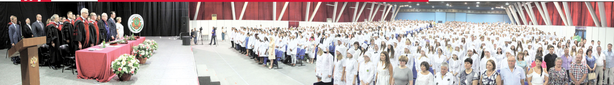
В ВолгГМУ прошло посвящение первокурсников в студенты.