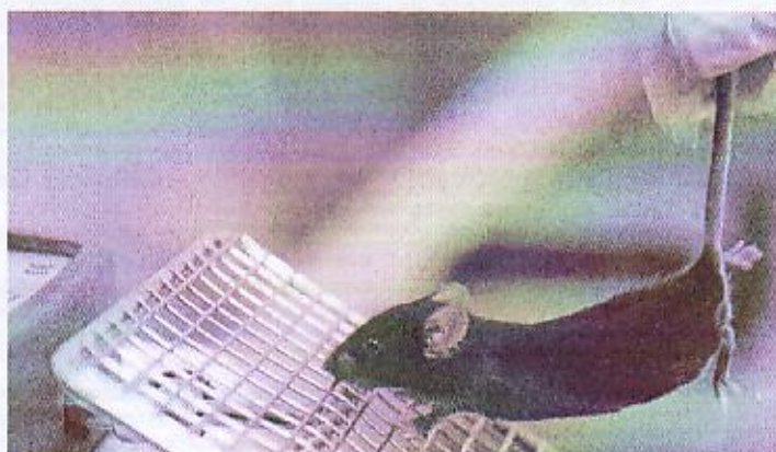
Рис. 4. Прибор измерения силы хватки

Ящик для изучения реакции пассивного избегания. Оценка реакции пассивного