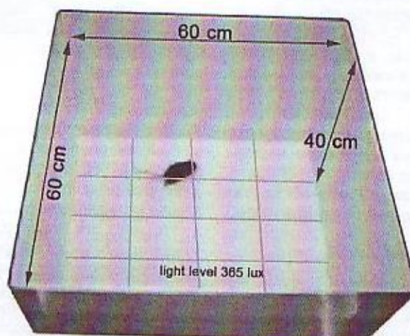
Рис. 2. Тест открытое поле

Ротарод. Животные помещаются на вращающийся валик, скорость вращения и ускорение которого контролируются экспериментатором (рис. 3). Время удержания животного на валике фиксируется автоматически.