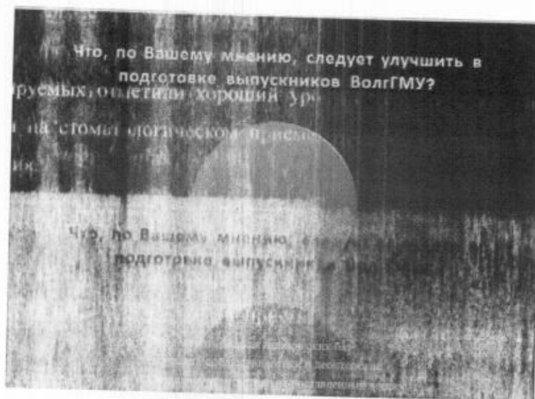
Рис. 2. Что необходимо улучшить в подготовке выпускников.

Большинство анкетированных отметили хороший уровень теоретических знаний, умение воспользоваться ими на стоматологическом приеме, грамотный подход к пациенту и к выбору метода лечения.