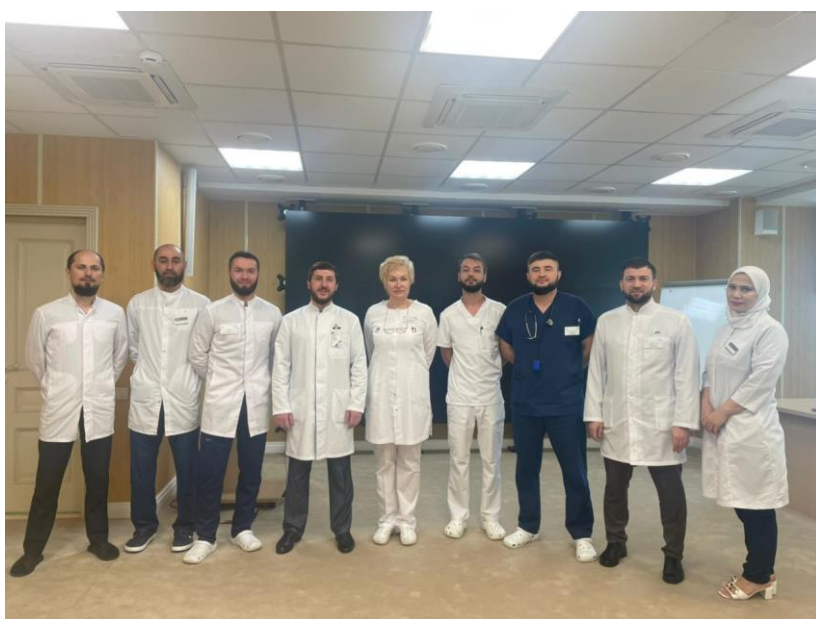
Фото 9. Коллектив Семейной клиники «АйМед», г Грозный, Чеченская республика, 2021 г