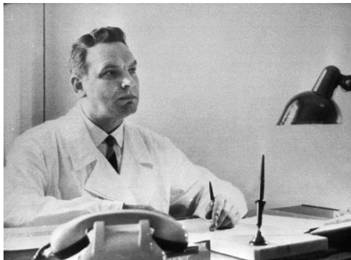
Фото 1 и 2.