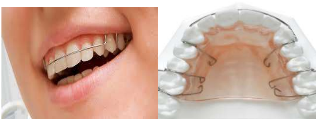
Рис.3. Ретенционная пластинка Hawley.

Самый распространенный из съемных ретенционных аппаратов является разработанный в 1920-х годах как механически действующий аппарат - ретенционная пластинка Hawley. Он состоит из кламмеров на молярах и вестибулярной дуги с регулировочными петлями, проходящей от клыка к клыку. Дуга обеспечивает контроль резцов. В ситуациях, когда после удаления первых премоляров необходимо сохранить экстракционные промежутки закрытыми, ретейнер Hawley стандартного дизайна такую функцию обеспечить не может, поскольку стандартная вестибулярная дуга проходит через место удаления первого премоляра, способствуя его переоткрытию. Для таких случаев делаются модификации ретейнера.