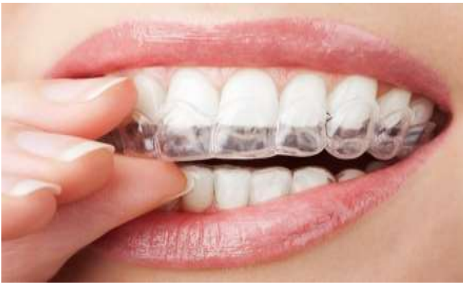
Рис.5. Штампованные ретенционные капы.

При изготовлении каппы необходимо включать в нее все прорезавшиеся зубы.