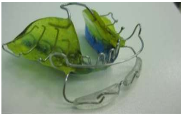
Рис.6. Функциональный аппарат Персина после лечения вертикальной резцовой дизокклюзии.

Саггитальный рост не требуется для коррекции небольшого окклюзионного отклонения, поскольку перемещение зубов возможно и при отсутствии роста, однако для предотвращения поворота нижней челюсти назад и вниз требуется некоторый вертикальный рост.