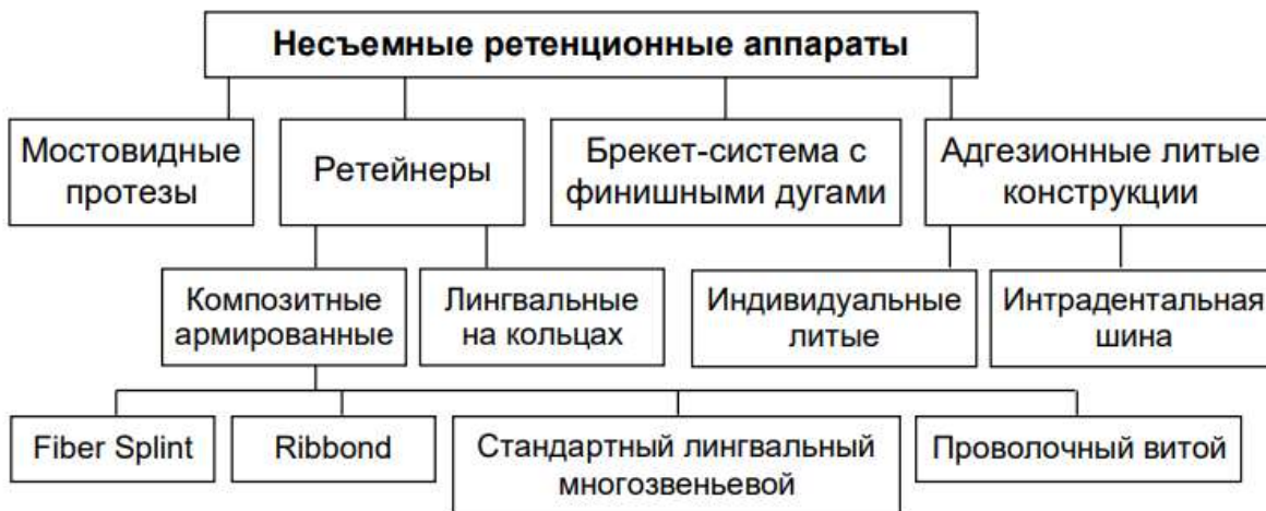
Рис. 2. Классификация несъемных ретенционных аппаратов

Из съемных эстетических ретейнеров хочется отметить OSAMU-ретейнер, который выполняет ту же функцию, что и позиционер, но расположен на одном зубном ряду. Состоит он из двух слоев. Мягкий эластичный внутренний слой надежно фиксирует и стабилизирует отдельные зубы, не препятствуя при этом свободному наложению и снятию аппарата (рис. 3). Из несъемных ретейнеров предпочтение отдают проволочным, фиксируемым на композиционный материал на небной и язычной поверхности (рис. 5). Для ретенционного шинирования может быть использовано стекловолокно Fiber Splint или Ribbon.