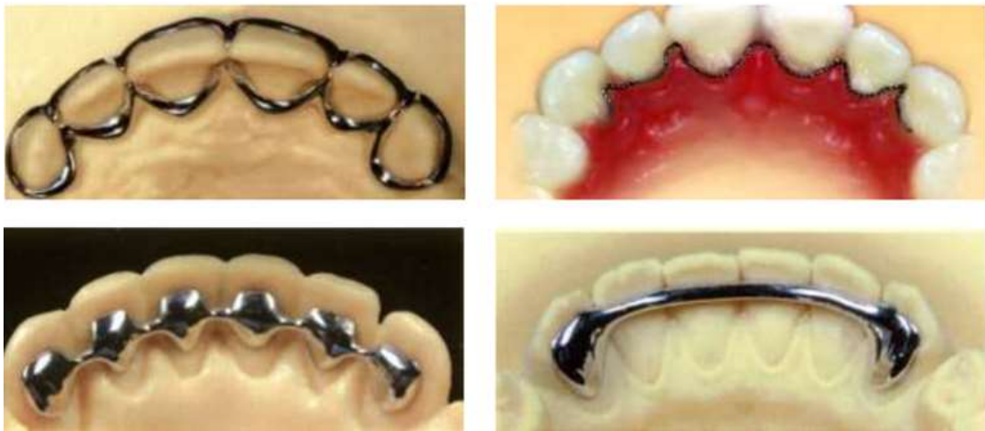
Рис. 5. Виды несъемных ретенционных аппаратов

Несъемные ретенеры эстетичны, они обеспечивают высокую надежность ретенции. Эти аппараты являются несъемными, но при их применении усложняется гигиена полости рта из-за невозможности использования флоссов, а также велика вероятность возникновения осложнения со стороны тканей периодонта. Важным шагом в направлении контроля зубного перемещения, приводящего к рецидиву аномалий дистального прикуса, является лечение с гиперкоррекцией. Даже при хорошей ретенции после лечения обычно изменяется положение зубов в сагиттальной плоскости. Это происходит довольно быстро после завершения активного лечения. Если в ходе лечения произошло перемещение резцов вперед более чем на 2 мм, будет необходима постоянная ретенция в виде, чаще всего, использования несъемного ретенера и продолжения ношения лицевой дуги. Можно также применять в качестве ретенера и функциональные аппараты, т. е. активаторы или бионаторы для удержания как положения зубов, так и прикуса. При коррекции открытого прикуса, обусловленного парафункцией языка, в качестве ретенеров используют