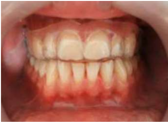
Рис. 4. OSAMU-ретенер в полости рта