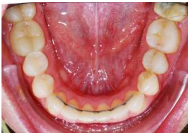
Рис.7. Приклеиваемый межклыковый ретейнер.

Однако каков бы ни был вид ретейнера, не рекомендуется, чтобы зубы жестко крепились в ходе фиксации. По этой причине при уменьшении проволочного интервала ретейнера после приклеивания промежуточного зуба или зубов, следует брать более гибкую проволоку, а именно витую стальную проволоку с диаметром 0175, поскольку чем меньше интервал, тем гибче должна быть проволока.