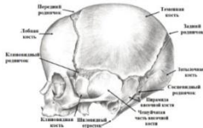
Рис. 8. Череп новорожденного. Вид сбоку

Чем меньше возраст ребенка, тем слабее развиты диплоические вены. У новорожденных крупные вены обычно отсутствуют, за исключением области лобной кости. Эмиссарии в костях черепа до 2-летнего возраста выражены слабо. Сеть диплоических и эмиссарных вен значительно увеличивается лишь к 9 годам, однако при наличии повышенного внутричерепного давления иногда эти сосуды развиваются раньше.