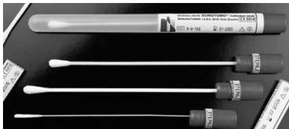
Рис. 2. Зонды-тампоны без среды

материала в операционном поле, экссудатов) используются зонды-тампоны коммерческого производства без транспортной среды (рис. 2) со сроком годности 30 месяцев со дня стерилизации.