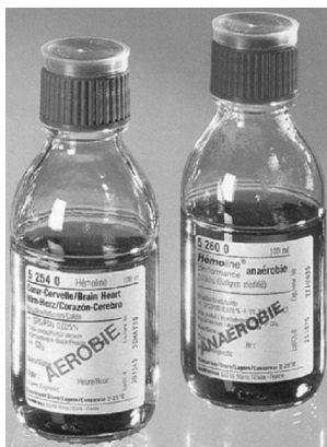
Рис. 3. Флаконы для забора крови с жидкими питательными средами для аэробов и анаэробов

При инфекционном эндокардите собирают по 2–3 пробы гемокультуры в течение 3 суток.